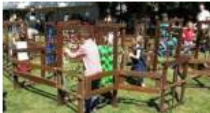
LABYRINTHE en BOIS Géant Grandeur Nature : le Dédale Sensoriel Pédagogique