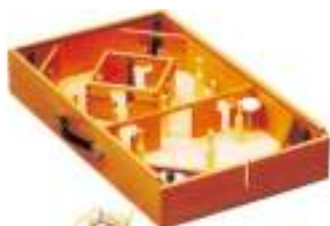
JEU DU ROI ET TOUPIE