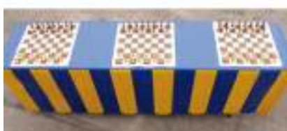
TABLE JEUX D'ECHECS