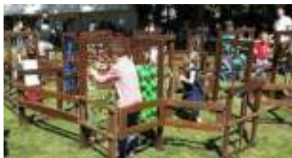
LABYRINTHE en BOIS Géant Grandeur Nature : le Dédale Sensoriel Pédagogique