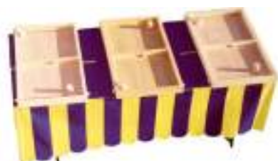
TABLE A ELASTIQUE