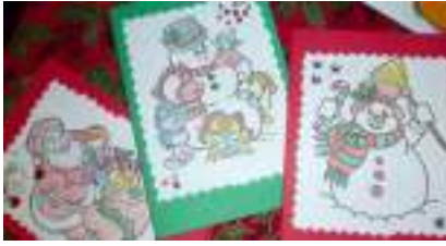
NOËL CRÉATIF: sapin étoile boule et carte de Noël