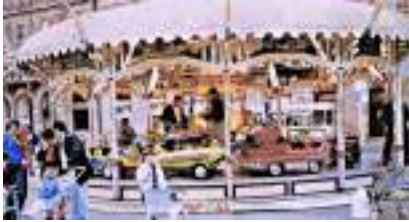
Manège Enfants Happy Days Auto Camion 1950